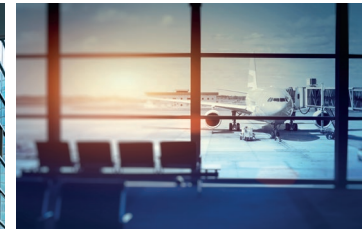
Die Folgen der Corona-Pandemie: enorme finanzielle Einbrüche an den Flughäfen und ein steigendes Kreditausfallrisiko bei den Sparkassen.

sind. Im öffentlichen Personennahverkehr (ÖPNV) schlugen ebenfalls enorme Einnahmeverluste aufgrund geringer Ticketverkäufe zu Buche. Vielerorts wurden die Angebote im ÖPNV zwar aufrechterhalten, jedoch nur ein Bruchteil der Fahrgäste hat diese auch genutzt. Und im Kitabereich kam der Betrieb größtenteils durch behördlich angeordnete Schließungen zum Erliegen (ausgenommen Notbetreuung).